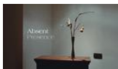
Absent Presence GIORGIA PONTICELLO