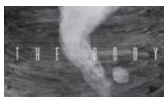
The Body N.ZHUKOVA - R.GEFEN